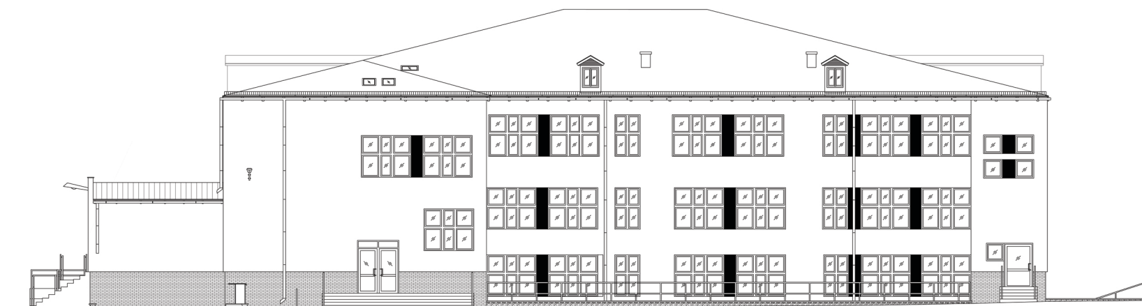
ELEWACJA PÓŁNOCNO - WSCHODNIA