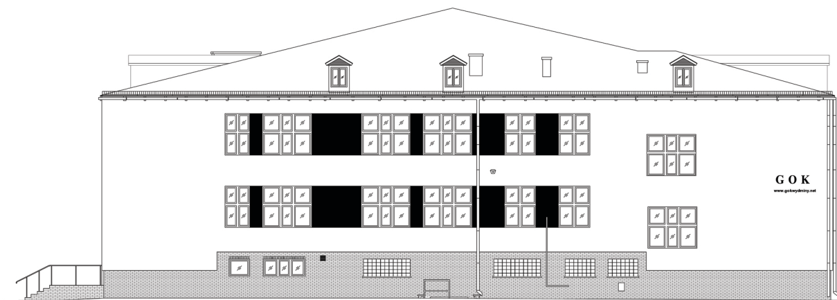
ELEWACJA PÓŁNOCNO - WSCHODNIA