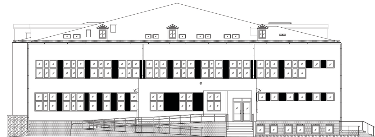
ELEWACJA POŁUDNIOWO - ZACHODNIA