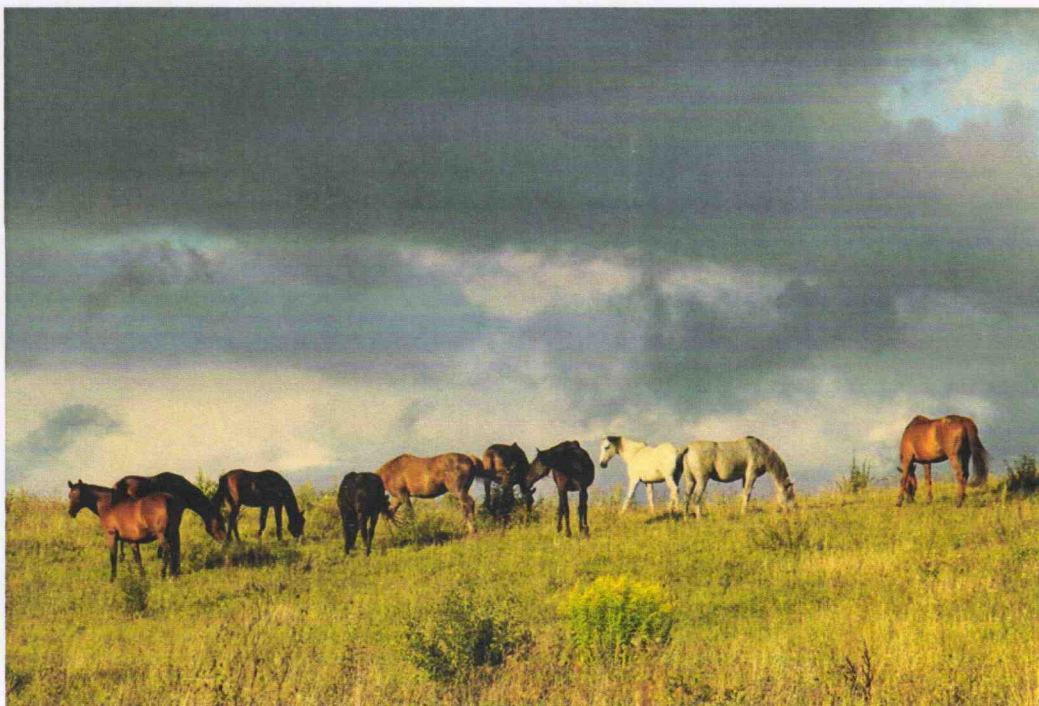
Konie z Centrum Reja