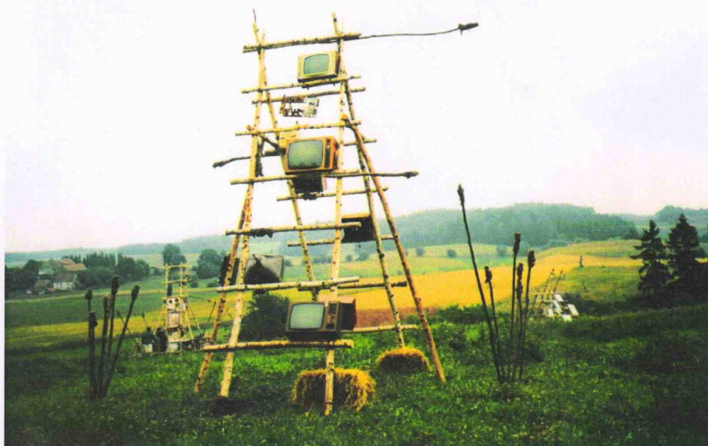
Panorama wsi ujęta poprzez scenografię Teatru IOTA